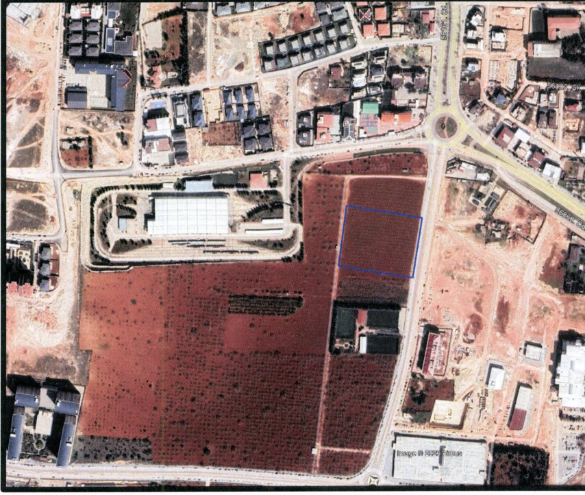
Planlama Alanının Konumu

Plan deęişikliğine konu olan, 15 Temmuz Mahallesi N38c-22a-2a, 2b paftalarında kayıtlı taşınmaz, Gaziulaş Genel Müdürlük ve Tramvay Bakım İstasyonunun güneydoğusunda bulunmaktadır.