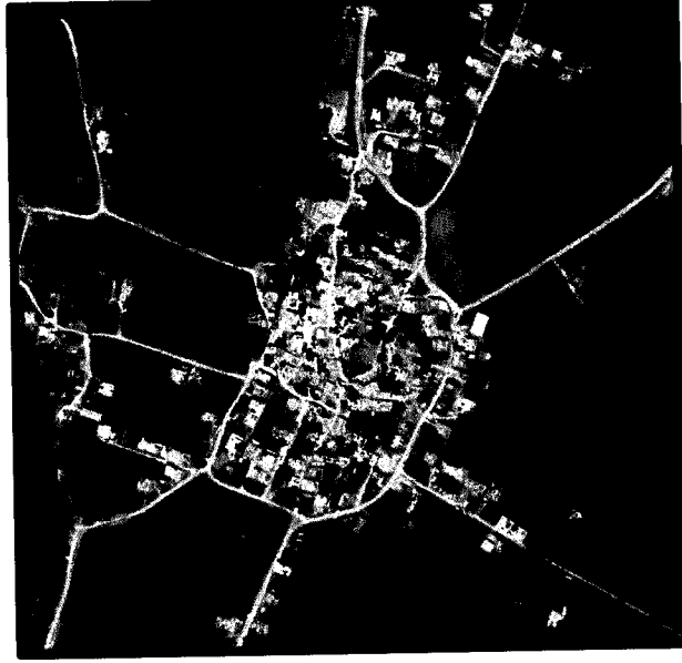
Planlama Alanının Konumu

Planlama alanına konu olan, Köksalan Mahallesi pafta N38a-25b-3d ada 127 parsel 12 ve 13 'de kayıtlı taşınmaz Köksalan İlköğretim okulunun güney doğusunda bulunmaktadır.